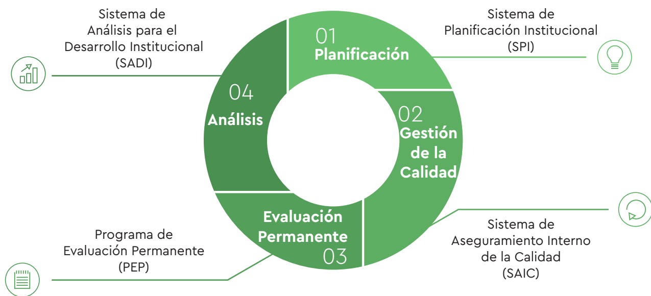
Figura N°1: Sistemas del Modelo de Aseguramiento de la Calidad